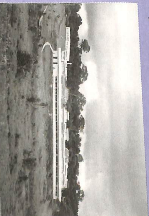
O terreno doado para o IIPC em julho e ao alto, a Holoteca do Ceac e os diversos laboratórios.

Ceac doa terreno ao IIPC Exemplo de fraternismo, cooperação e altruísmo, a ciência Conscienciologia ganha espaço no planeta!