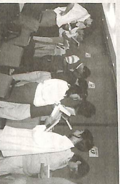
A heterocrítica já começa na escolha do livro pelos alunos.

Em 25 de agosto, já contabilizamos 50 inscrições.