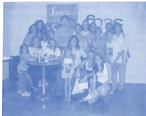
Criança não é criança: está criança.

Portanto, estes novos livros representam a vitória de jovens mulheres e também de rapazes que agora tem mais um exemplo a seguir. Com a Invéxis, os homens imitam o Cavalo Marinho, pois também podem estar "grávidos" de boas idéias, é claro :-).