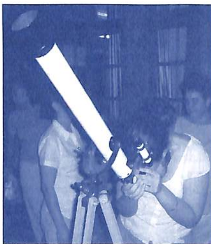
Alunos apreciam o céu estrelado do Campus IIPC: saturação para exoprojeções.

na prática, trabalhando os quatro veículos de manifestação por atacado, em uma rotina útil. As atividades que se destacaram são as oficinas mentaissomáticas, exercícios físicos, orientação especializada para reeducação alimentar, gincanas, cosmograma diário e montagem de um quebra-cabeça de 1.530 peças.