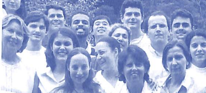
Equipe docente na II Qualificação Docente, em janeiro, no Campus IIPC.

No 15º Congraçamen- to das Instituições Conscienciocêntricas (ICs), em dezembro de 2002, a mesa que reuniu um representante de cada IC definiu em consenso que o materspense do IIPC, o seu alicerce, é a Parapedagogia . O IIPC comemora uma década e meia