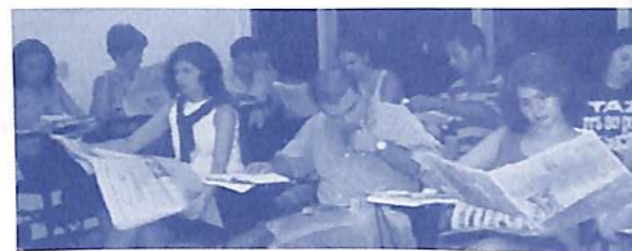
Uma das 4 turmas universitárias, aprendendo a fazer a técnica do Cosmograma (recorte e classificação de periódicos) útil para autodidaxia e incremento da cultura pessoal e profissional.

A coragem do nomadismo consciencial, de cortar o cordão umbilical com a cidade em que vivemos, é uma realidade cada vez maior na comunidade conscienciológica. É a migração daqueles que abrem trincheiras no Planeta e reforçam as frentes assistenciais onde seus trafores forem mais úteis para a assistencialidade maior. A mudança de cidade ou mesmo itinerâncias open minds nos descondiciona da cultura e holopensene local. Nossas etapas de vida são determinadas pela união das necessidades intraconscienciais e assistenciais. O mundo nos espera: há muitos cantos e povos aguardando a tarefa do esclarecimento.