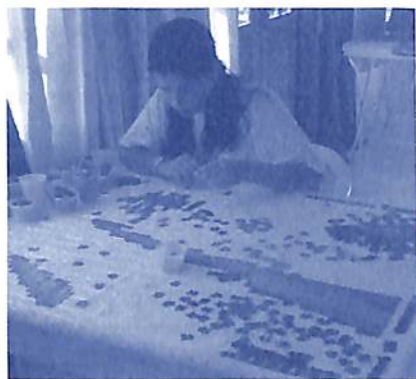
Quebra-cabeça de 1.530 peças: desafio para a concentração e vontade

O programa foi desenvolvido com o objetivo de propiciar aos participantes a oportunidade de experimentar o cotidiano do conscienciólogo