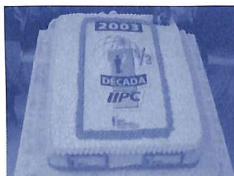
Bolo de aniversário do IIPC, em 16 de janeiro, data de sua fundação.

O IIPC atendeu, nos dias 5, 6 e 7 de fevereiro, a Universidade Cândido Mendes (www.ucam.br) com uma equipe de 8 professores em quatro salas de aula para apresentar os conceitos da Conscienciologia e da Projeciologia a 160 alunos que ingressaram na faculdade. Os cursos univer-