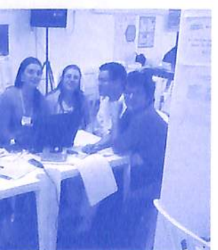
Colegiado jurídico, que não mediu esforços para que o novo estatuto ficasse pronto