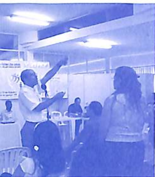
Debates para chegar ao consenso cosmoético