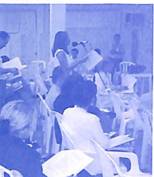
Filas se formaram para discussão de detalhes do estatuto