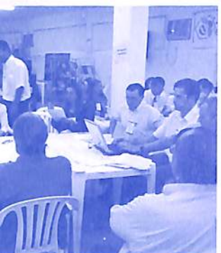
Colegiado definindo sua estrutura e objetivos