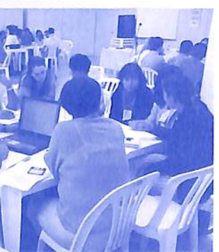
Colegiado definindo sua estrutura e objetivos