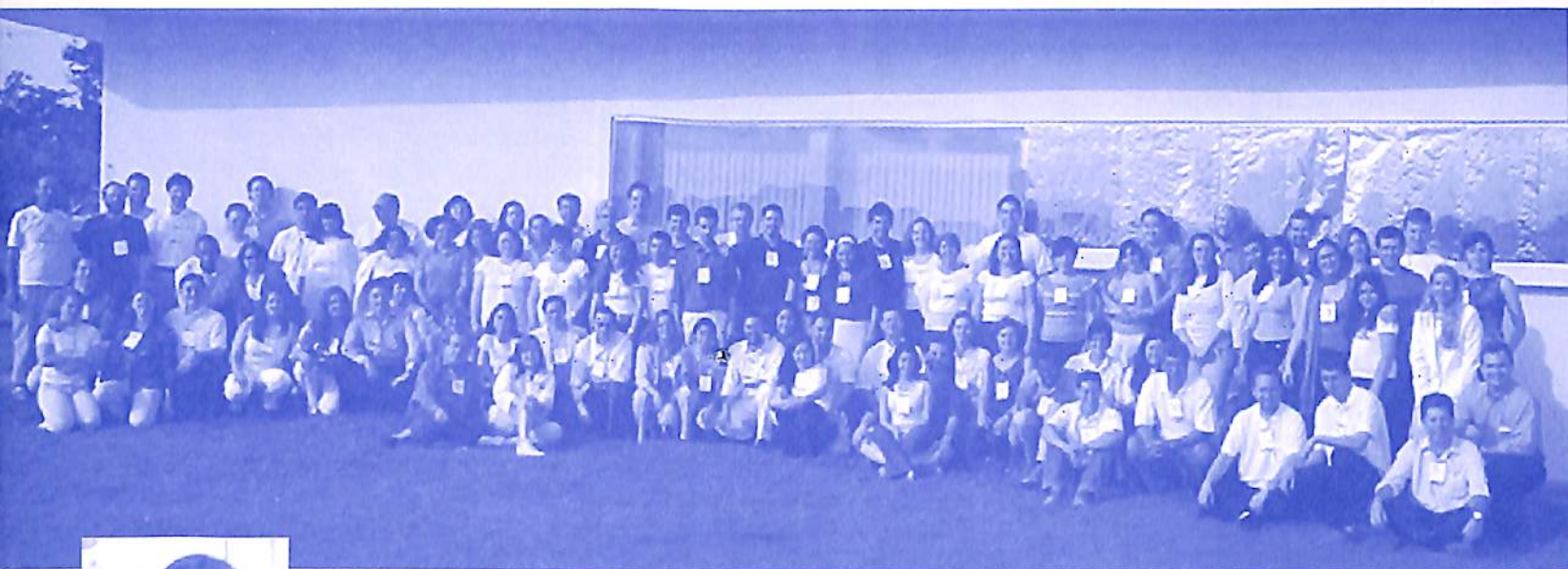
Participantes da I Assembléia Geral de Voluntários do IIPC, em Foz do Iguaçu.