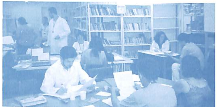
Alunos no Pesquisarium. Última etapa da turma de Porto Alegre

Atualmente 3 Centros Educacionais de Autopesquisa já contam com este ambiente: São Paulo, Porto Alegre (CIEC-IIPC) e Belo Horizonte.