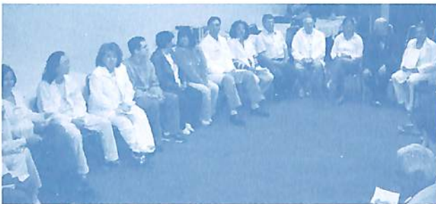
Avaliação final do curso em São Paulo

Agora o IIPC conta com o curso no formato modular (módulos 1 e 2) e no formato extensivo. Este curso visa a elaboração de um artigo conscienciológico baseado na autopesquisa dos alunos-pesquisadores através da utilização de técnicas usadas na Enciclopédia da Conscienciologia, além de aprofundar temáticas relacionadas à cientificidade, parapsiquismo mentalsomático e assistência através da tares gráfica.