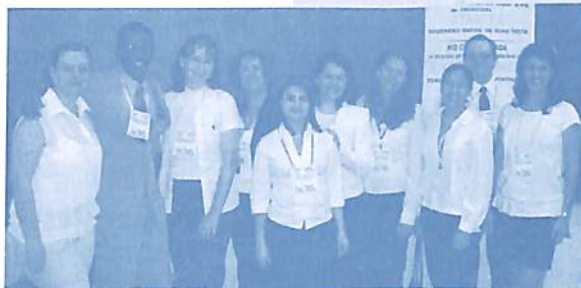
Equipe de Professores do IIPC no evento