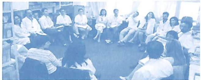
Avaliação final do curso em Porto Alegre

Comunicabilidade. Desenvolvimento da comunicabilidade oral e escrita através dos debates abertos, exposição dos achados de pesquisa, da criticidade cosmoética e da argumentação mentalsomática.