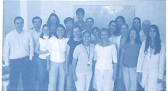
Última turma do Curso de Parapedagogia em 2005 - Foz do Iguaçu