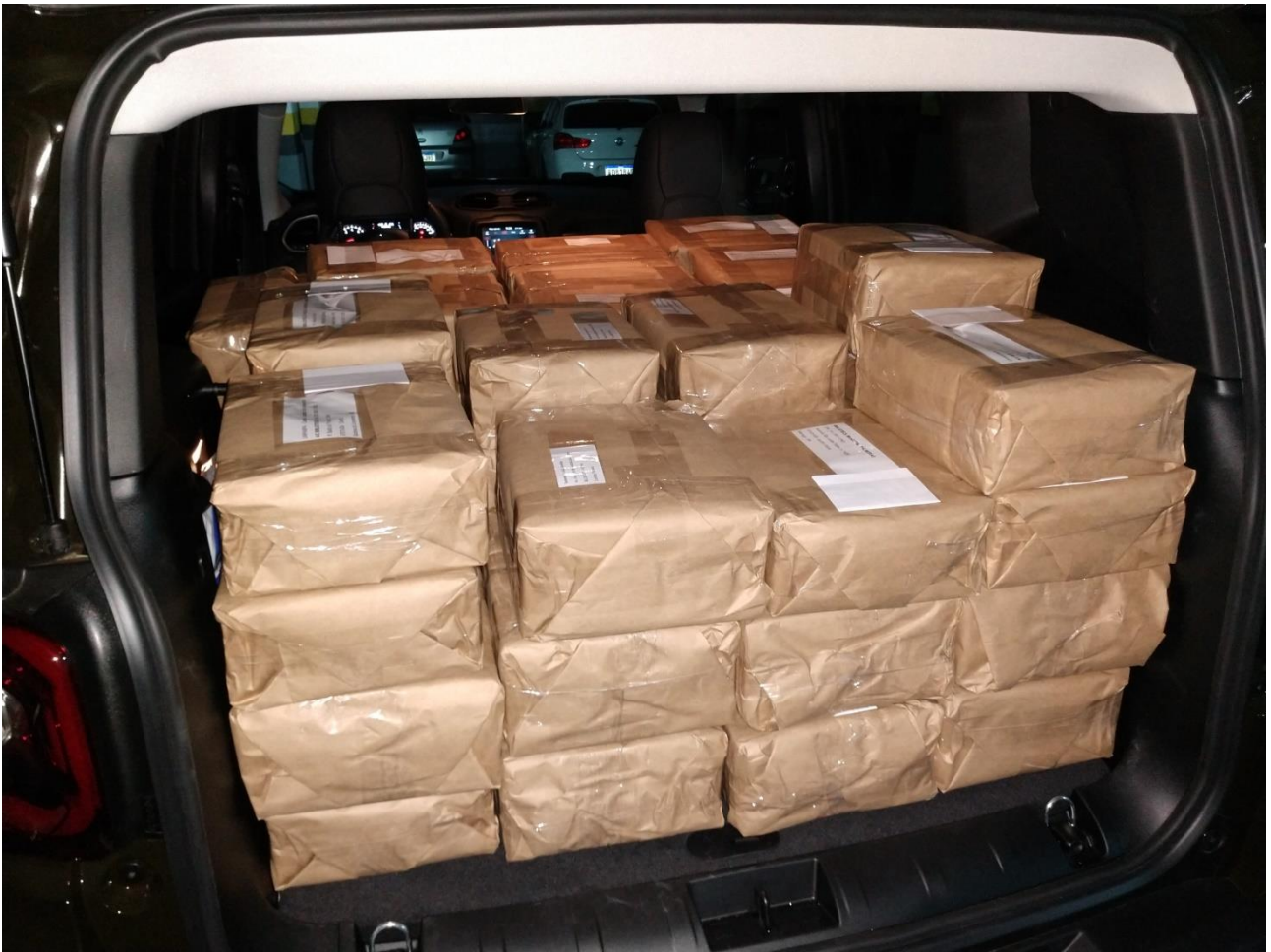
Despacho de 75 LOs from Curitiba, PR para diversos estados do Brasil