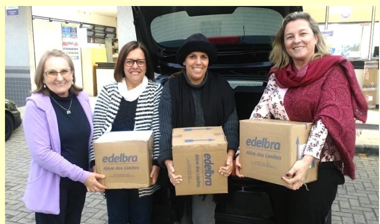
Doação para Orthocognitivus , Santa Catarina