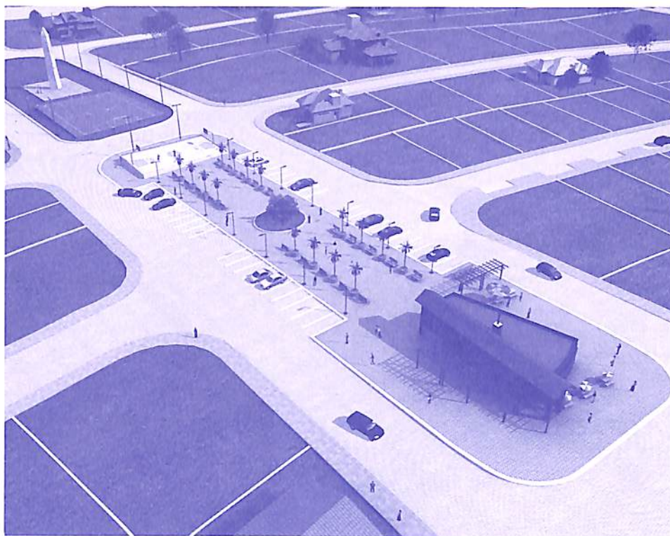
Rua principal da Villa Conscientia - Vista aérea.

Vale lembrar que todos os prazos são estimativas dentro de um trâmite burocrático normal.