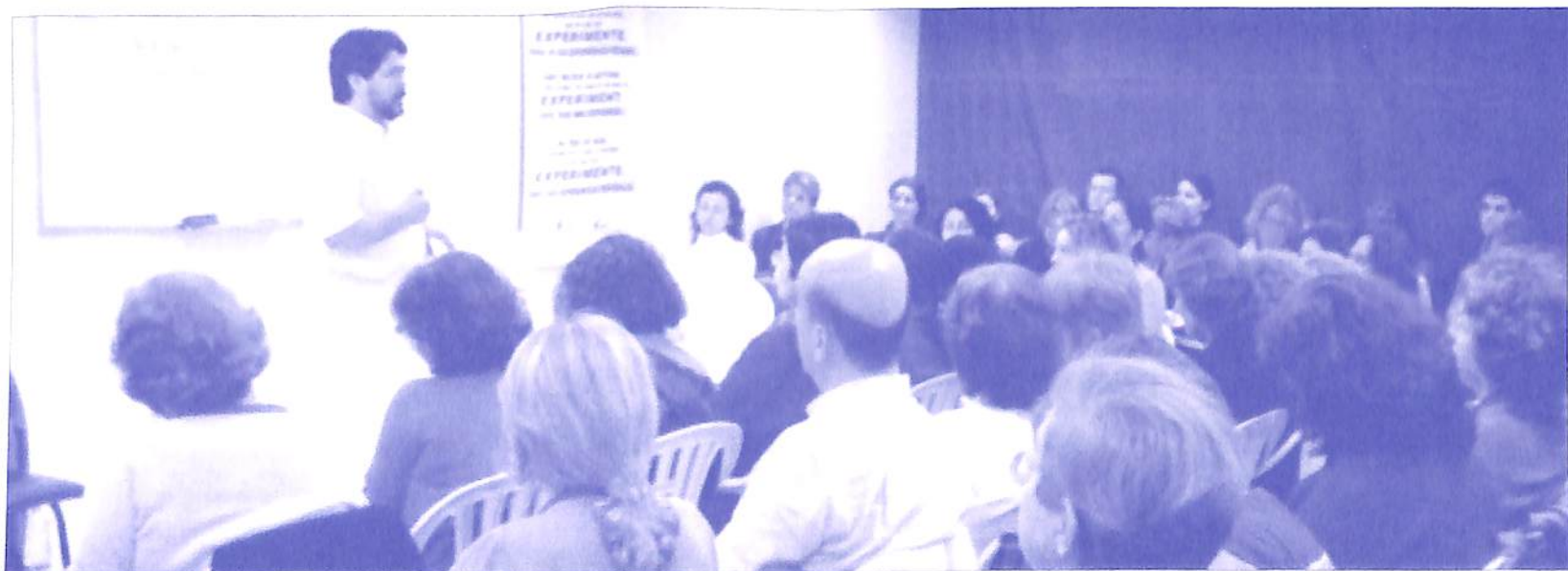
Curso Autoprofilaxia Através da Autoconsciencioterapia na Prática em Porto Alegre (RS) - 2004