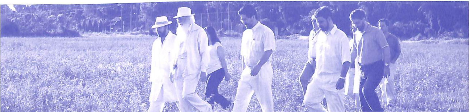
Visita ao Campus OIC - 2005

Órgão responsável por estabelecer diretrizes, critérios e normatizações da prática consciencioterápica, extensiva a todas as atividades da instituição.