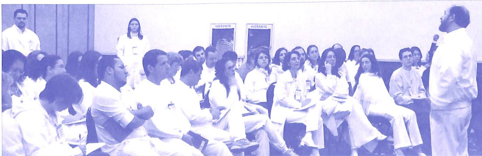
Curso Imersão Projecioterápica - 2005