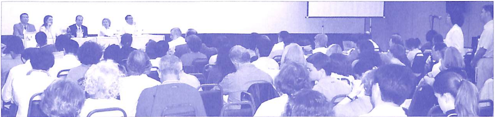
III Jornada de Saúde da Consciência - 2003

7. Dia da Saúde, evento gratuito e aberto à comunidade, com periodicidade anual.