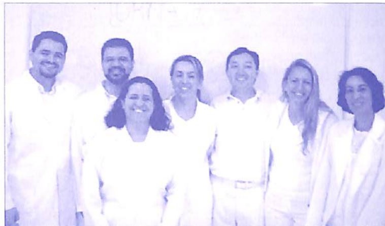
Professores e alunos da 7ª turma do CFC - 2005

E-mail de contato: fomacaotecnica@oic.org.br