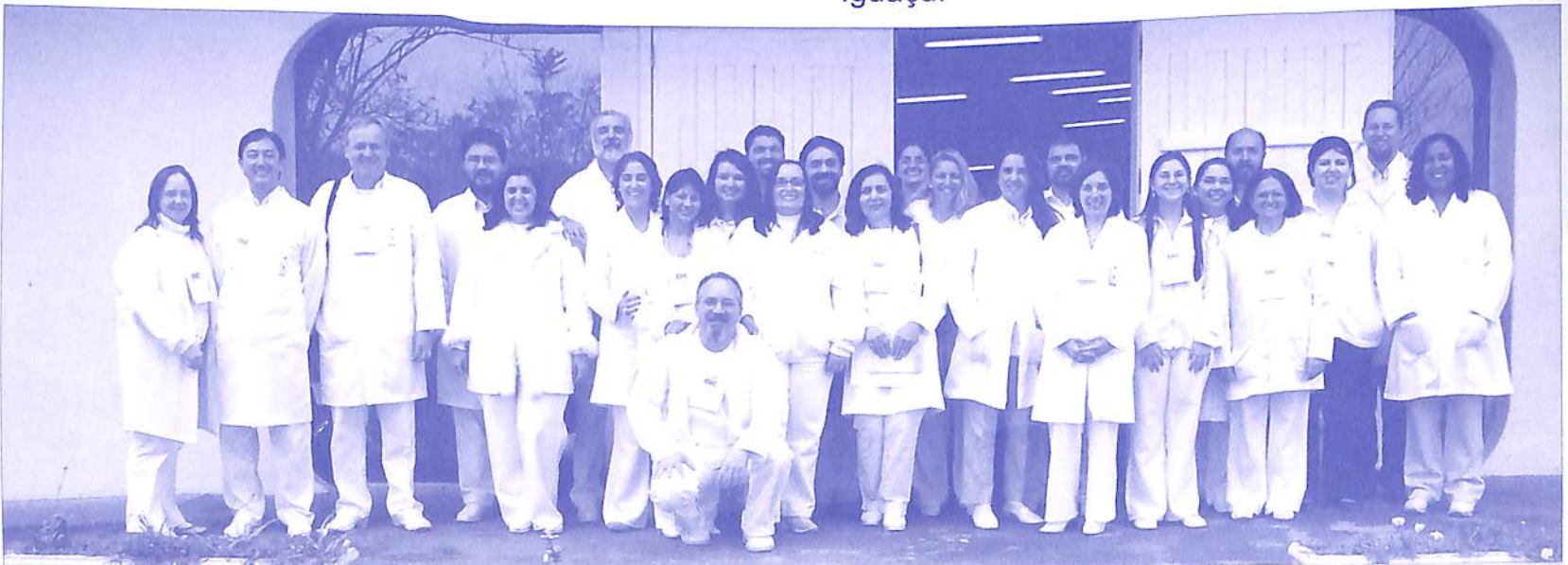
Voluntários da OIC durante a IV Jornada de Saúde da Consciência - 2006

A OIC já atuou, com atendimentos consciencioterápicos, no exterior, em Barcelona (Espanha), Lisboa (Portugal), Nova Iorque (EUA) e no Brasil, em São Paulo, Belo Horizonte, Rio de Janeiro e Foz do Iguaçu.