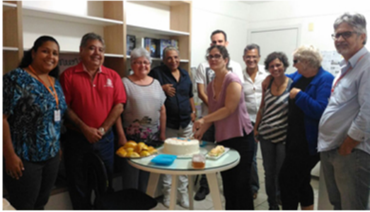
Aniversário de Intercampi - 11 anos de Atividades Evolutivas