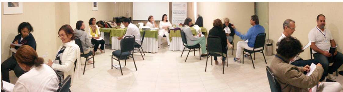
Curso Imersão Mentalsomática Bioenergética (IMB) - Park Hotel - Boa Viagem