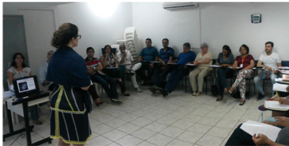
Oficina para Qualificação de Integração do Voluntariado