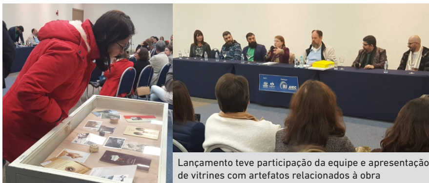
Lançamento teve participação da equipe e apresentação de vitrines com artefatos relacionados à obra

O romance já foi levado à telona em 2010, no documentário O último romance de Balzac , do cineasta Geraldo Sarno. No documentário-ficção, Sarno entrevistou o professor Waldo Vieira sobre os detalhes da psicografia. A produção foi premiada no 38º Festival Internacional do Cinema de Gramado.