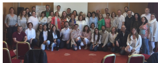
Curso Efeitos do Perdão, realizado em Lisboa