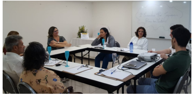
I Encontro Pró-Cognópolis

A primeira providência para a instalação intrafísica do empreendimento será a implantação do Campus da INTERCAMPI, que depende da troca de um terreno já existente para esse fim, distante 40 quilômetros da capital, por outro, geograficamente mais próximo. A partir daí, o grupo planeja adquirir áreas nas proximidades e fazer a venda antecipada de lotes, juntamente com o projeto arquitetônico. “O Campus INTERCAMPI é a semente da Cognópolis Rosa dos Ventos”, afirma o integrante da