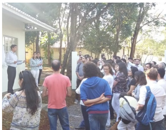
Fotos: Inauguração do Centro de Apoio ao Serenarium