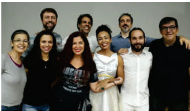
Cast composto da volontari della Coscienziologia

Per tornare, Alexandre dovrà recuperare alcune personalità del passato, contribuendo agli accordi tra un professore universitario e la figlia attivista e tra un ebreo e un arabo. La narrativa ha affrontato ampi temi coscienziologici