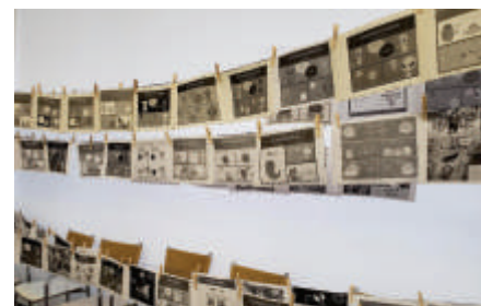
Fumetti fatti dai bambini

la loro creatività per produrre 1850 giocattoli dipinti e assemblati e 261 fumetti creati da software, tra gli altri. Bambini di varie città, persone in sedia a rotelle, disabili, autistici, che hanno potuto sfogliare, leggere, analizzare e creare le proprie storie. Il bambino più piccolo che ha cercato di fare Gibi aveva 3 anni e molti bambini di 4 anni hanno fatto le proprie storie con totale libertà di creazione, come pensavano e si esprimevano, racconta un volontario.