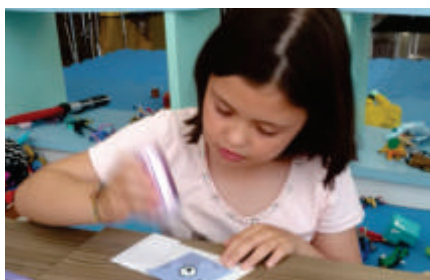
I più piccoli ne hanno approfittato.

In questa fiera i visitatori hanno usato