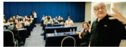
Il premiato sceneggiatore incontra Cognópolis