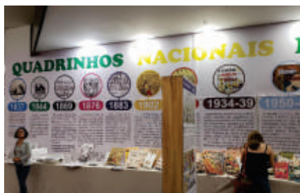
Fumetti nazionali in 150 anni

Tra il 30 gennaio e il 10 febbraio, il CEAEC ha promosso una mostra per commemorare il 150° anniversario del Comic Stories, al JL Cataratas Shopping. Sono stati 12 giorni di attività ludiche, di intrattenimento, di creazione di fumetti e letture di cui hanno goduto 7.797 persone, il 10% del pubblico del centro commerciale in questo periodo, provenienti da 14 stati brasiliani, 7 città internazionali, 12 etnie e 4 lingue.