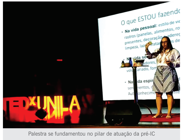
Palestra se fundamentou no pilar de atuação da pré-IC