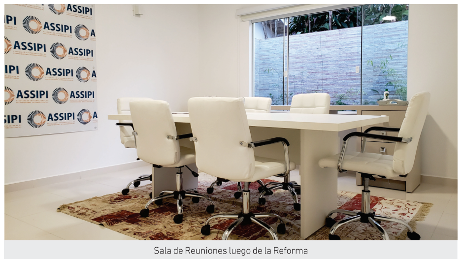
Sala de Reuniones luego de la Reforma