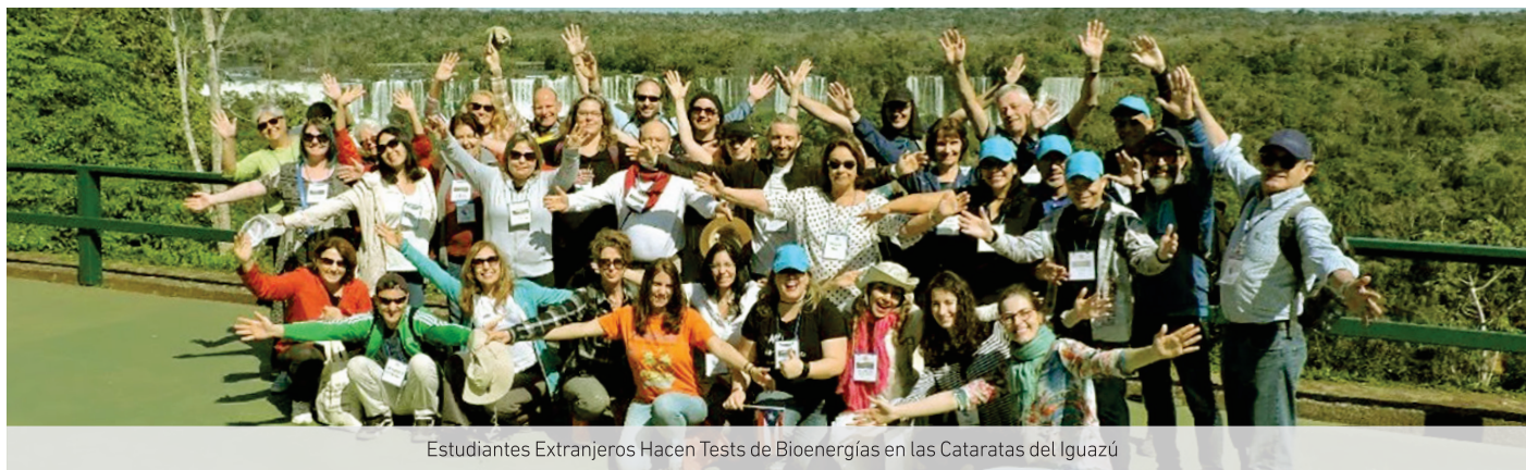
Estudiantes Extranjeros Hacen Tests de Bioenergías en las Cataratas del Iguazú

Informativo de la Comunidad Cosmoética Concienciológica Internacional