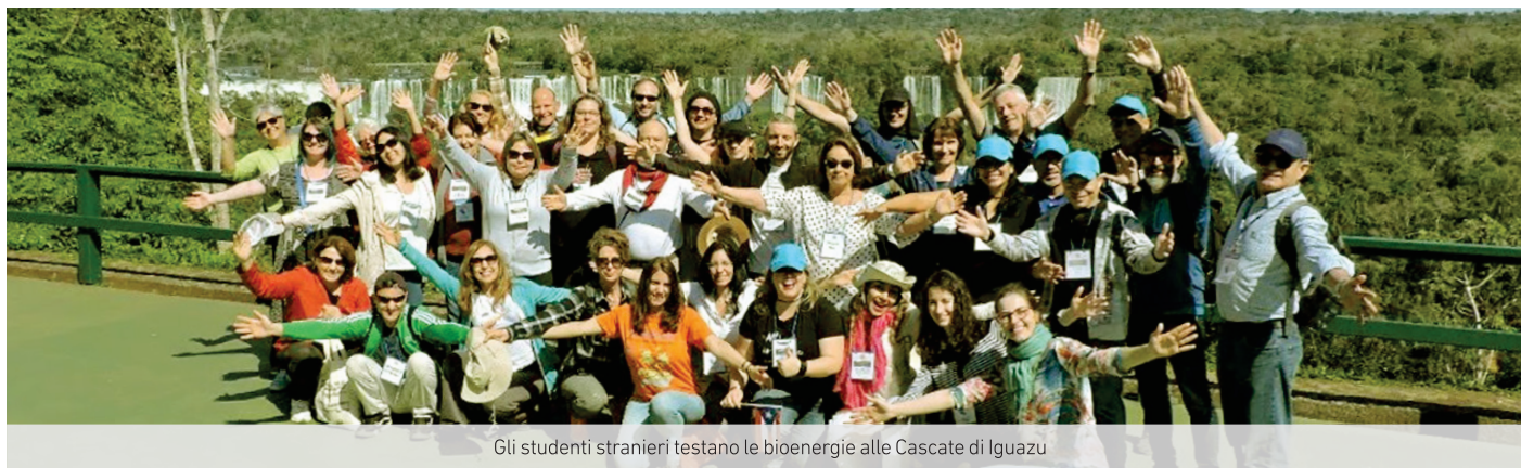
Gli studenti stranieri testano le bioenergie alle Cascate di Iguazu

Informativo della Comunità Coscienziologica Cosmoetica Internazionale