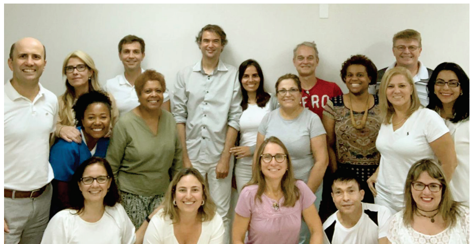
Collaborazione dell'Assipi e dell'Relendentia in Portogallo