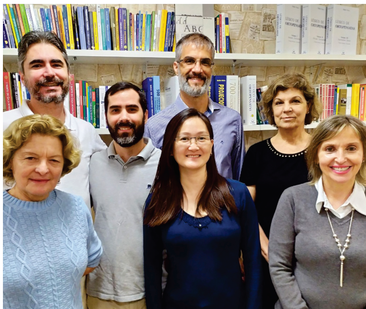
Parte de la dotación de voluntarios de la IC

Actualmente, el grupo está compuesto por unos 15 voluntarios y cuenta con la colaboración de decenas de especialistas