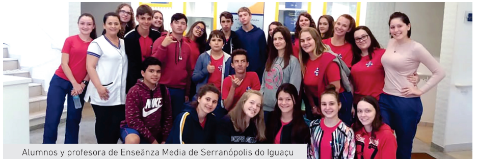
Alumnos y profesora de Enseñanza Media de Serranópolis do Iguaçu