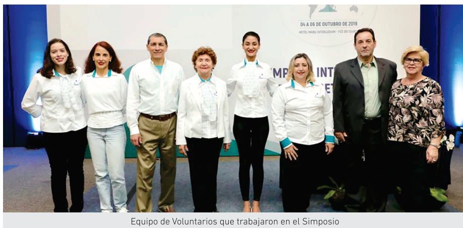
Equipo de Voluntarios que trabajaron en el Simposio