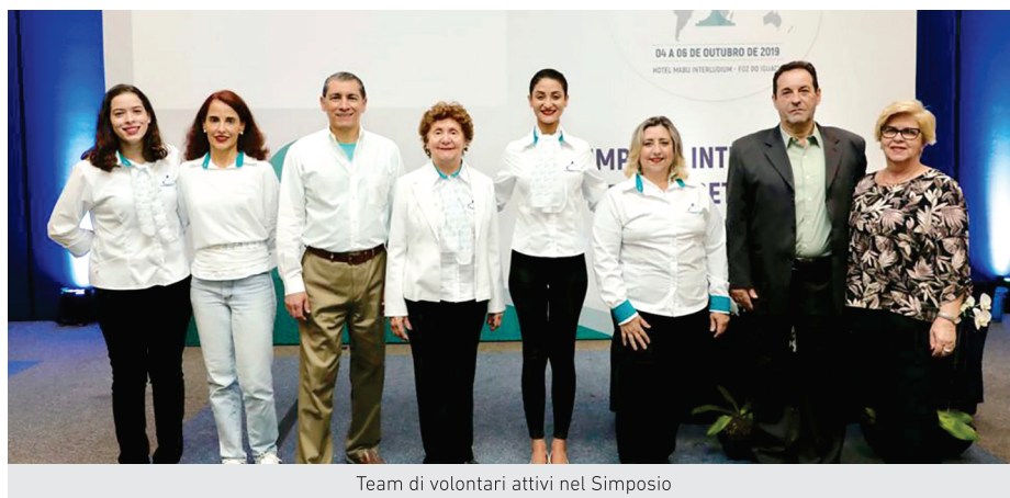
Team di volontari attivi nel Simposio

Il Simposio ha avuto 13 relatori, 11 articoli pubblicati sulla rivista, un circolo mentalsomatico con lo stesso tema del Simposio e, nella settimana precedente l'evento, la difesa delle voci dei volontari di Cosmoethos e dei relatori del Simposio. Il team di Cosmoethos ha valutato che questo primo Simposio ha contribuito a chiarire il concetto di democrazia, consentendo di ampliare la sua concezione teorica in vista di approfondire gli aspetti che intrecciano il regime di governo democratico e la Cosmoetica, con l'obiettivo di qualificarne sempre più l'esercizio, con particolare attenzione all'installazione dello Stato Cosmoetico Mondiale in futuro.