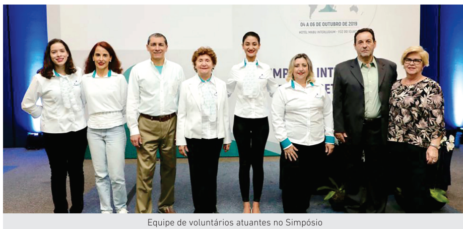
Equipe de voluntários atuantes no Simpósio