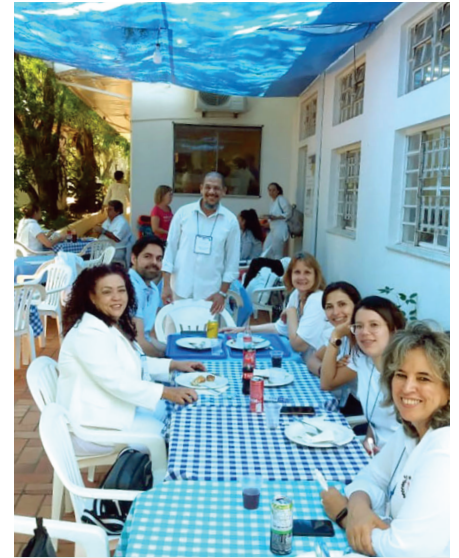
Almuerzo en el restaurante Sabor y Letras

una nueva edición en 2021, anhelando grandes reurbanizaciones.