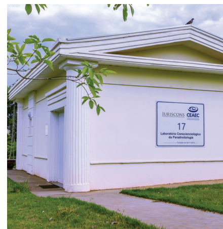
Laboratório da Paradiroitologia, no Campus CEAEC

Durante a Pandemia do Covid-19, a instituição vem atendendo voluntários da Conscienciológica, através da Consultoria Parajurídica : um serviço gratuito que visa esclarecer quanto às melhores práticas para conflitos do dia a dia, considerando princípios da Paradiroitologia. Mais informações desse serviço e das atividades oferecidas pela Juriscons podem ser obtidas no site: juriscons.org ou pelo contato whatsapp : (45) 99111-6263.