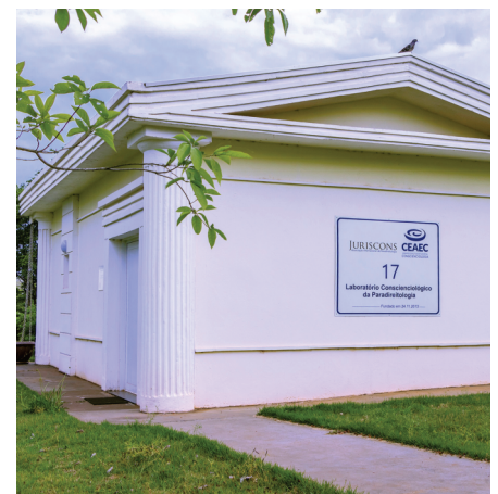
Laboratorio de Paraderechología en el Campus CEAEC

Durante la Pandemia de Covid-19, la institución viene atendiendo a los voluntarios de Concienciológica, a través de la Consultoría Parajurídica : un servicio gratuito para esclarecer en cuanto a las mejores prácticas para los conflictos cotidianos, teniendo en cuenta los principios de Paraderechología. Puede obtener más información sobre este servicio y actividades en el sitio: www.juriscons.org o en el WhatsApp (45) 99111-6263.