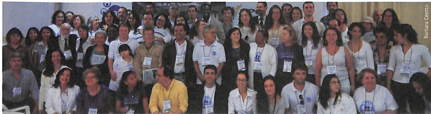
Participantes do I Encontro da Paz no Campus IIPC em Saquarema-RJ

O Centro Educacional IIPC Rio de Janeiro está vivendo tempos de pacificação. O movimento de reurbanização holopansênica começou em junho de 2007, durante o Congresso de Parapedagogia, em Foz do Iguaçu, quando os voluntários do centro carioca firmaram a ideia da construção do primeiro laboratório de autopesquisa da paz. O comprometimento surgiu a partir de uma conversa com o professor Waldo Vieira. Com o livro Homo sapiens pacificus na mala, presenteado por Vieira, a equipe retornou à cidade certa de que muito