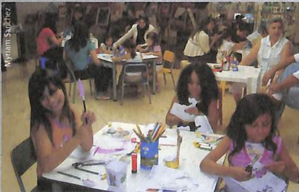
Crianças concentradas no Projeto Brinquedoteca.

Este foi o título da segunda edição do Projeto Brinquedoteca Itinerante que recebeu, de 10 a 17 de outubro, mais de seiscentas crianças no Cataratas JL Shop-