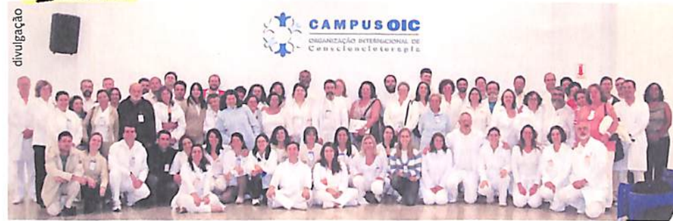
A 14ª edição do curso foi a primeira realizada na nova sede da instituição.