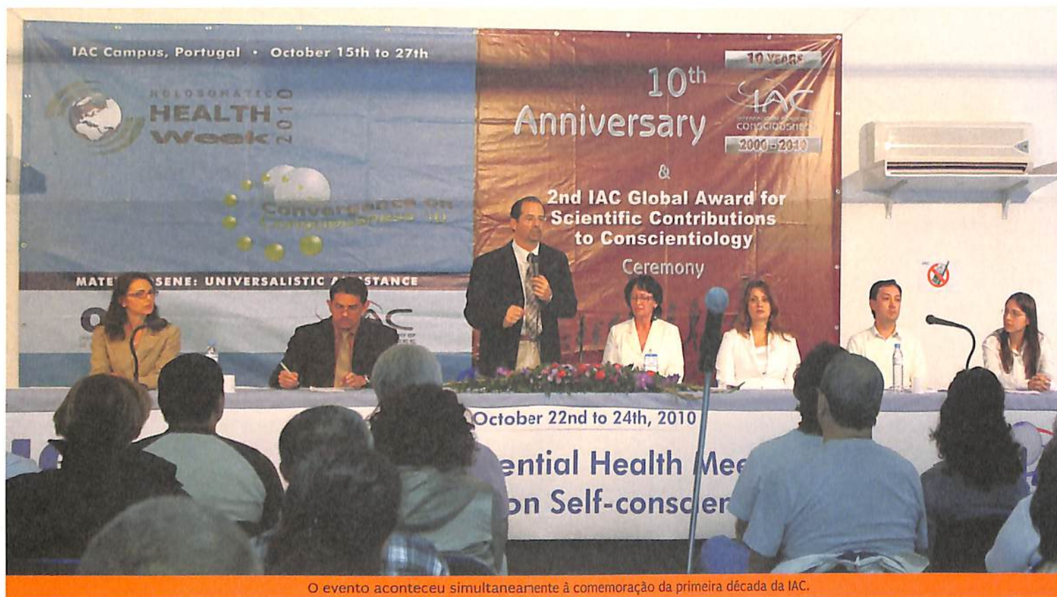
O evento aconteceu simultaneamente à comemoração da primeira década da IAC.