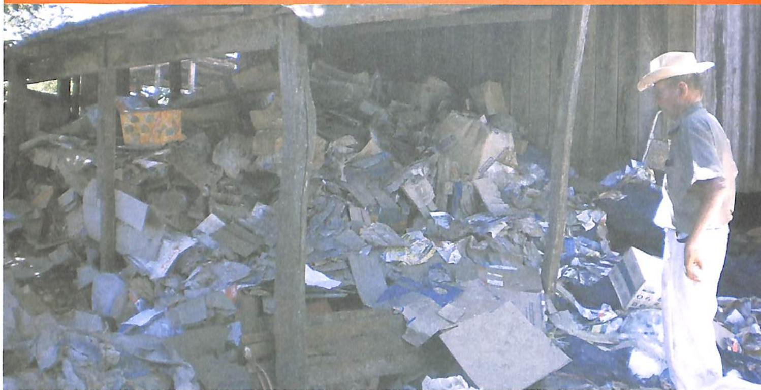
Sr. Emílio dá exemplo de "mão na massa" em termos de reciclagem de lixo.