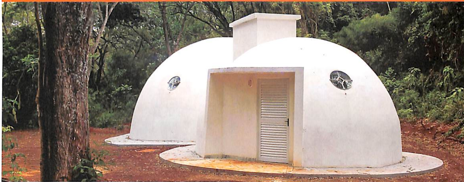
O Serenarium – Laboratório Radical da Heurística já está pronto e os experimentos começarão no segundo semestre.