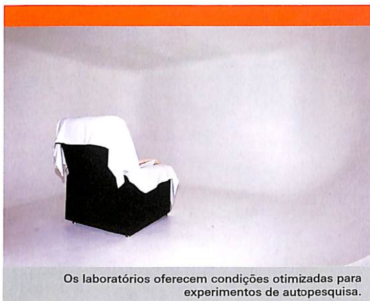
Os laboratórios oferecem condições otimizadas para experimentos de autopesquisa.