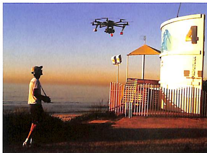
Arthur e o multirotores de 8 hélices: tecnologia para captação de imagens aéreas.

Fica o convite a conhecê-los. Experimente, tenha suas próprias experiências!