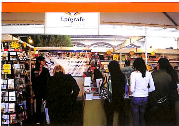
O estande da livraria Epígrafe recebeu muitos visitantes.