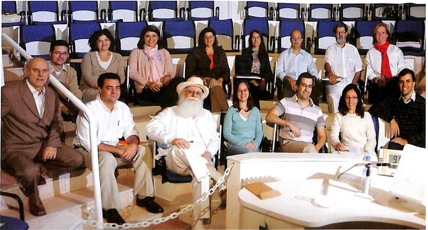
Os autores presentes no dia 28 de abril: a iniciativa visa à criação de um ambiente ainda mais propício aos debates.