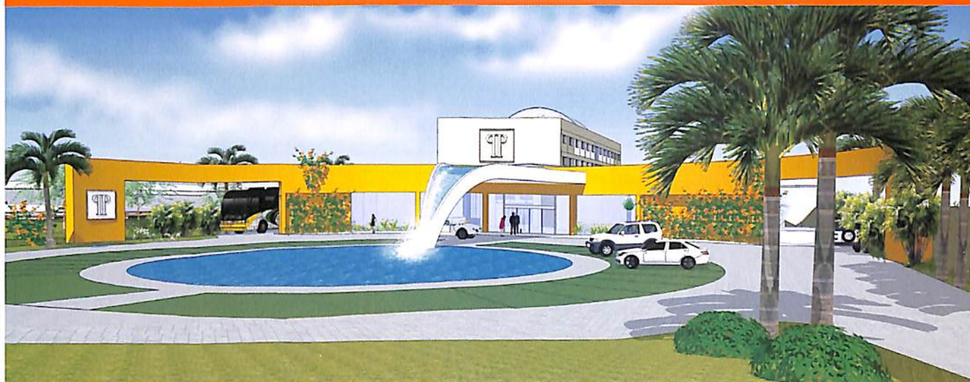
Visitantes da Cognópolis terão opção de hospedagem ao lado do CEAC e Discernimentum