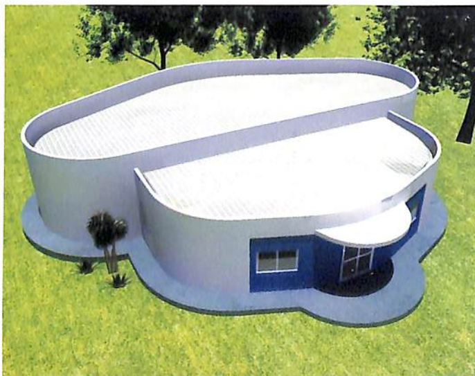
Próxima meta é a construção do Laboratório das Dinâmicas Parapsíquicas