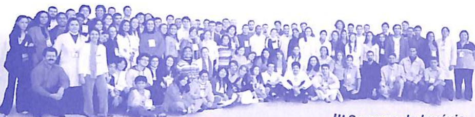
III Semana da Invéxis.

Quanto à escolaridade, a maioria tem Ensino Superior completo ou cursando (60%), 27% tem pós-graduação e 13% está no Ensino Fundamental ou Médio. As áreas de graduação que prevalecem são: Biologia (8 pessoas), Psicologia (6 pessoas), Medicina (5 pessoas), Engenharia (4 pessoas), seguidas de Comunicação, Informática, Direito (3 pessoas cada). Em relação à ocupação, grande parte é estudante (33%), 23% são professores, 5% empresários, 3% estagiários, 3% auxiliares administrativos, entre outros.