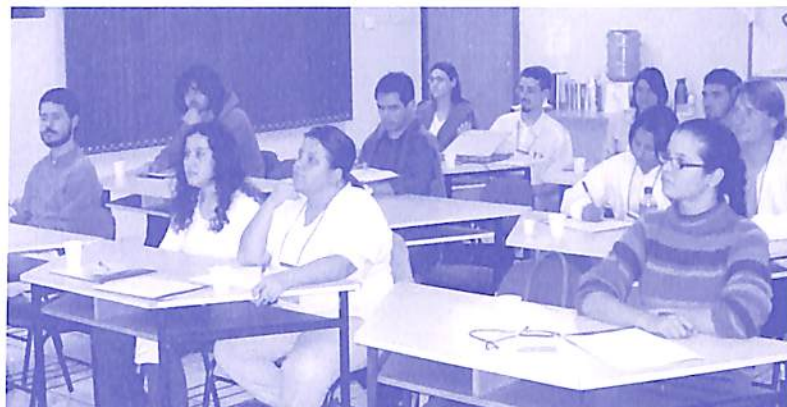
TPIE Foz do Iguaçu - 27 e 28 de maio de 2006

A palestra anterior ao curso de São Paulo contou com a participação de 30 pessoas.