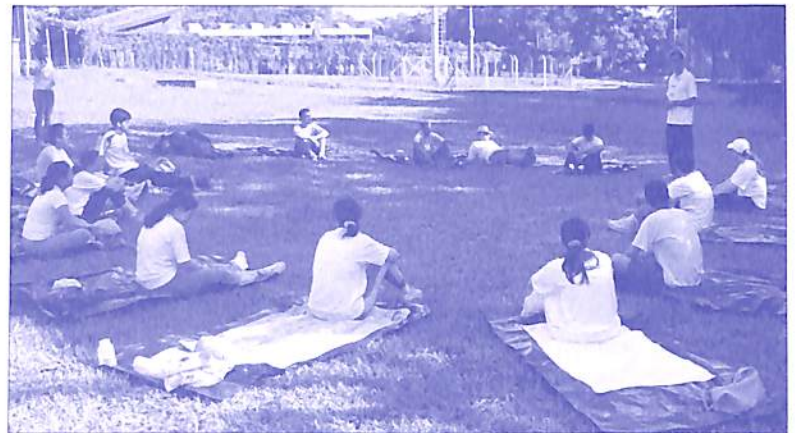
BIOCAM realizada no dia 14 de outubro de 2006

A instituição pretende realizar regularmente a BIOCAM a fim de proporcionar maior contato dos participantes com as fontes extensas de energia imanente.