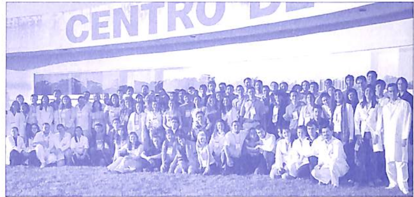
4ª Semana da Invéxis realizada de 07 a 13 de julho de 2006

Nos três primeiros dias de evento realizou-se o laboratório Acomplamentarium com o prof. Alexander Steiner. No laboratório ficou marcada a intensa atuação dos amparadores. Houve relatos referentes à presença de estudantes de Curso Intermissivo que