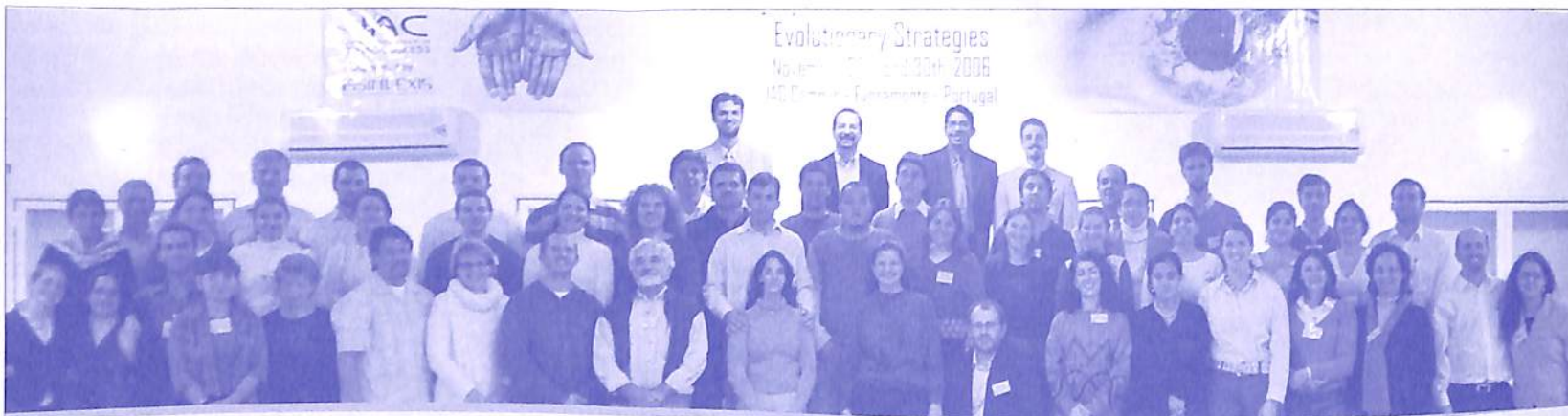
1º Simpósio Global de Inversão Existencial realizado no campus de pesquisa da IAC nos dias 29 e 30 de novembro de 2006