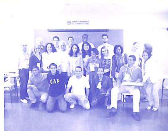
Alunos e professores do Curso Prática da Tridotação na Invéxis no Rio de Janeiro

Em janeiro de 2011 foi oficialmente inaugurado o núcleo da ASSINVÉXIS no Rio de Janeiro, na ocasião da terceira edição do Curso Prática da Tridotação na Invéxis, de 20 a 23 de janeiro de 2010, com o estudo da personalidade de Leonardo da Vinci. Foram, ao todo, 18 alunos, dentre os quais 1 tornou-se voluntário da instituição. A localização do núcleo é privilegiada, pois está imerso em ambiente universitário (sala da UniverCidade). O acesso da instituição aos jovens foi facilitado, bem como o acesso dos jovens à invéxis. Parabéns a todos os voluntários do Rio de Janeiro por mais essa conquista em prol dos intermissivistas.