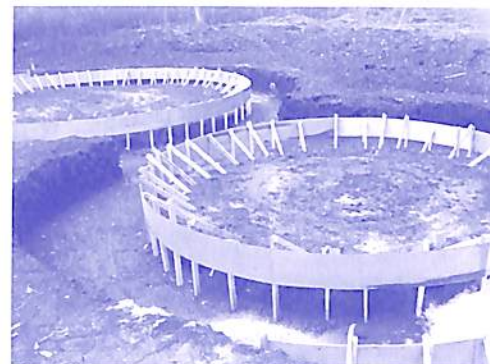
Obras da fundação do Serenarium – Campus de Invexologia, Cognópolis, Foz do Iguaçu (PR).

O evento de lançamento do campus , no dia 16 de julho de 2008, foi presenciado por 140 participantes provenientes da Argentina, Austrália, Brasil (Bahia, Distrito Federal, Espírito Santo, Mato Grosso do Sul, Minas Gerais, Paraná, Rio de Janeiro, Rio Grande do Sul, Rondônia, Santa Catarina e São Paulo), Espanha, Estados Unidos, França e Portugal.