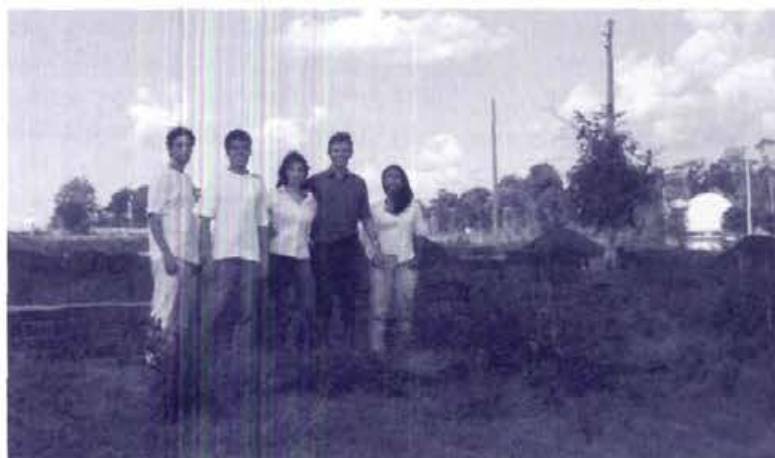
Inversores visitam o terreno adquirido pela Assinvéxis