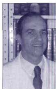
Porão Consciencial e Proéxis Prof.º Hermante Leite - Foz do Iguaçu, PR