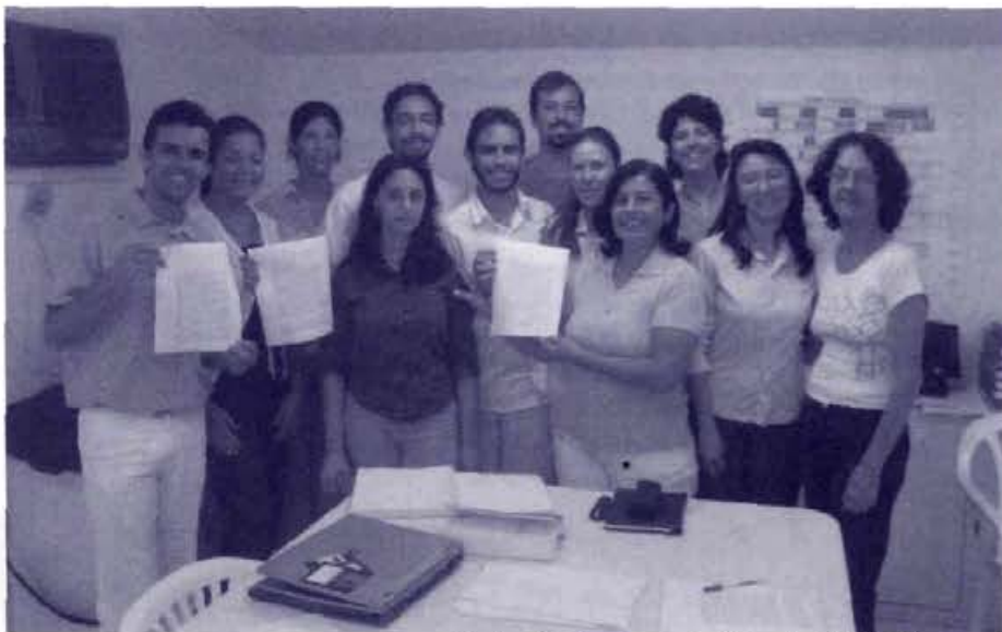
Equipe Assinvéxis e Jurídico do CEAEC firmando contrato da compra do terreno

Espera-se agregar cada vez mais novos talentos na equipe. Todos estão convidados a participar desse novo momento na Conscienciologia: a integração das Instituições Conscienciocêntricas (ICs) em Foz do Iguaçu.