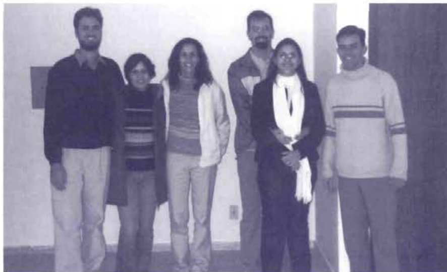
Voluntários da ASSINVÉXIS visitam a nova sede da instituição

ASSINVÉXIS Associação Internacional de Inversão Existencial