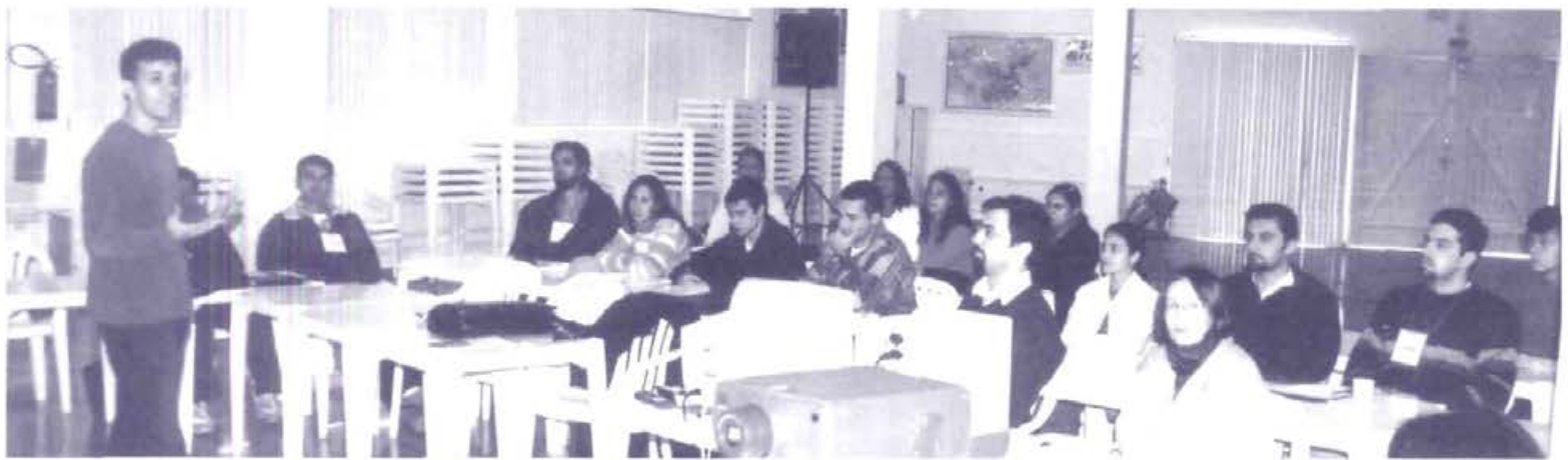
Reunião da ASSINVÉXIS com inversores de Foz do Iguaçu, Porto Alegre, Curitiba e Florianópolis para definição do Estatuto

A Associação Internacional de Inversão Existencial - ASSINVÉXIS - é uma instituição conscienciocêntrica, sem fins lucrativos, científica, educacional, apolítica, independente e universalista, dedicada a promover e disseminar a técnica da Inversão Existencial e, conseqüentemente, a Conscienciologia.