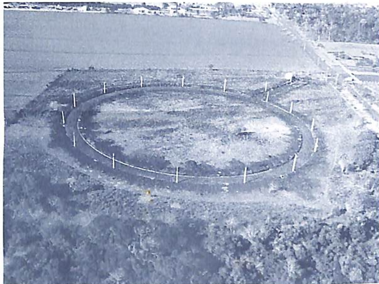
Foto aérea do Condomínio Campo dos Sonhos

O Condomínio Conscienciológico Campo dos Sonhos, primeira concepção de condomínio conscienciológico, está em fase de urbanização. Os proprietários estão se organizando para construir casas no loteamento de 65.841 m 2 situado às margens da Estrada Velha de Guarapuava, a menos de 1 quilômetro do Centro de Altos Estudos da Conscienciologia (CEAEC).