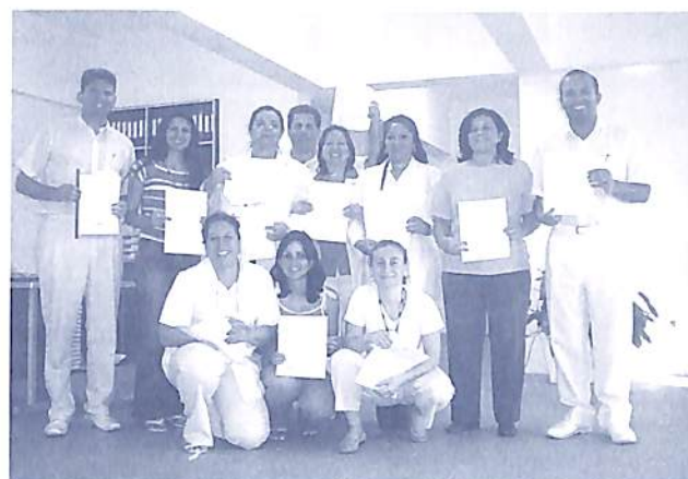
Voluntários da APEX

Entre os dias 17 e 25 de fevereiro de 2007, será realizado no CEAEC, a II Semana da Proéxis. Serão três eventos de profunda reflexão sobre os fundamentos da maxiproéxis da Conscienciológica: o Curso Balanço Existencial , Fundação da IC e o Acomplamentarium Especial em Proexologia . No Balanço estão programadas conferências, debates, apresentação de biografia, talk show , cineproéxis, oficina de consciencioterapia, campo proéxico. Serão 31 professores de Conscienciológica envolvidos no evento.