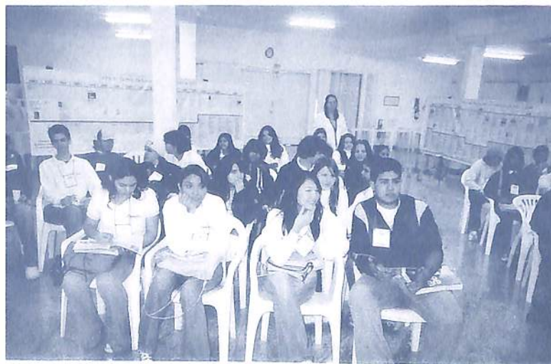
Palestra introdutória no salão da Holoteca