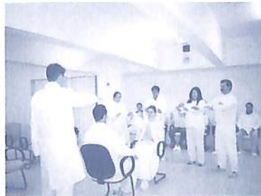
Salão das Dinâmicas após reformas.

5. Novo espaço administrativo do CEAEC. Vale registrar a renovação do salão do CEAEC (antigo salão de eventos), a começar pela reforma do local onde ocorrem as Dinâmicas Parapsíquicas, agora com nova pintura, cadeiras e poltronas mais apropriadas e novo sistema de ar-condicionado, entre outras renovações. É importante observar que na parte administrativa, divisões foram instaladas visando criar ambientes otimizados para as atividades. Os setores do CEAEC locados são: divulgação, eventos, editorial (CEAEC-Editares), técnico-científico e também a minigráfica responsável pela impressão dos verbetes da Enciclopédia da Conscienciológica distribuídos no Tertulium .