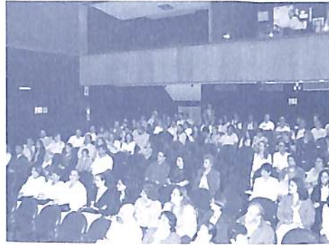
Palestra de inauguración de la exposició en Itaipu Binacional.

1. Carteles coloridos gigantes de pared realizados en tres idiomas (portugués, español e inglés).