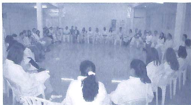
Curso Imersão Mesológica em 2006.

Renova-se o convite para a participação no III Fórum da Tenepes para o qual devem-se trazer as vivências do labcon pessoal, visando o amplo debate e o balanço dos resultados do trabalho assistencial, principalmente ao se levar em conta as ofiexes que daí começam a resultar. O evento, também aberto para candidatos à prática da tenepes, está organizado com conferências, mesas de debate e outras atividades, objetivando contribuir para a definição e o planejamento de metas de modo a qualificar o desempenho de cada tenepessista na condição de minipeça no mecanismo da megafaternidade.