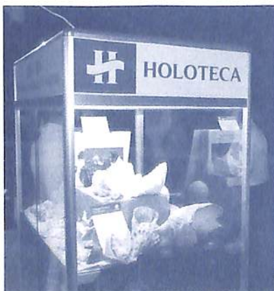
Uno de los expositores.

Se entrega en todas ellas, a cada niño, una carpeta con varios tipos de accesorios de acuerdo con la actividad que desarrollarán. Hasta el momento de hoy el retorno de los niños es sumamente significativo y productivo, con lo que podemos concluir que el trabajo hasta ahora realizado es solo el inicio de una asistencia cultural sin límites, usando la figura de Lastanosa como ejemplo histórico.