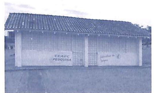
Laboratório da Tenepes.