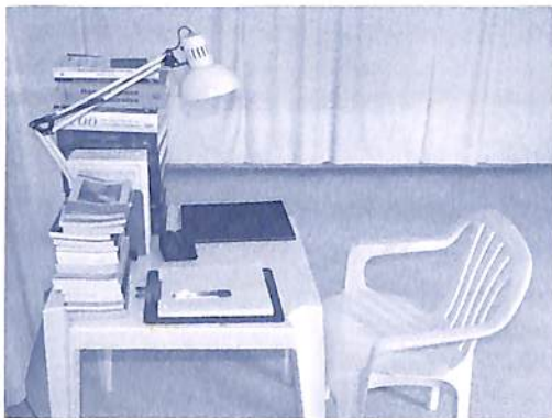
Interior do laboratório

A principal reforma do ano foi a do Laboratório de Técnicas Projetivas, que precisou ficar interditado até setembro para pintura e reparos. Mas o tempo que ficou interditado valeu à pena, pois hoje o laboratório está em excelentes condições de uso.