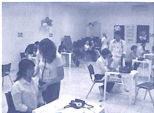
Ação em Saúde Consciencial

A Organização Internacional de Consciencioterapia (OIC) realizou nos meses de agosto e setembro de 2008 dois eventos com a participação de diversos voluntários da CCCI e com resultados positivos no âmbito da saúde consciencial: o Dia da Ação em Saúde e a Semana da Saúde Holossomática da Cognópolis.