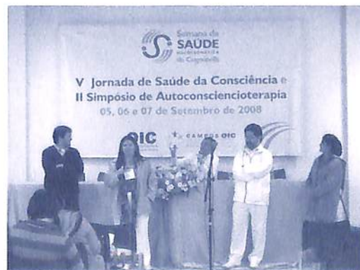
Semana da Saúde Holossomática da Cognópolis.