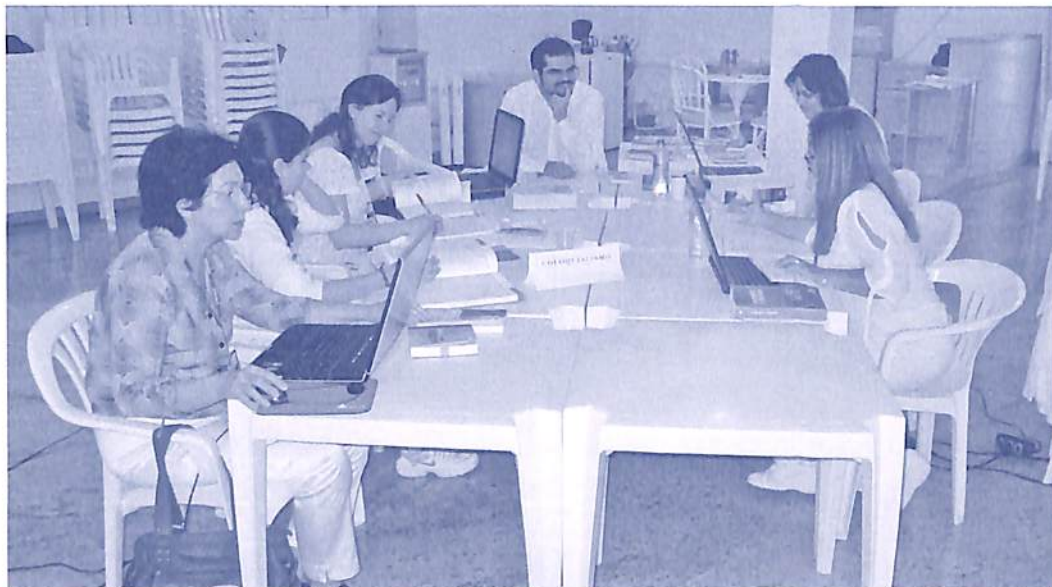
2ª Edição do curso Lexicologia, realizado no Campus CEAEC

O CEAEC promove entre os dias 3 a 5 de julho a quarta edição do curso Lexicologia. O evento propõe uma jornada estimulante de autopesquisa através da Lexicologia (estudo dos dicionários). Serão três dias de aulas práticas e teóricas, inclusive com a utilização do acervo de dicionários do Holociclo - a Lexicoteca. Atualmente, há 5.300 obras à disposição nos mais variados temas e idiomas.