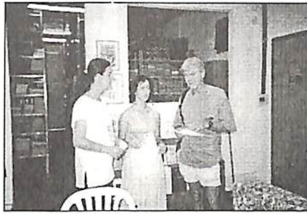
King durante visita à Biblioteca do CEAEC

Mc Nutt também achou bastante positivo o trabalho no CEAEC, principalmente do método de pesquisa. "Estou impressionado que vocês tenham achado um modo de estudar a consciência através da experiência. Muito do