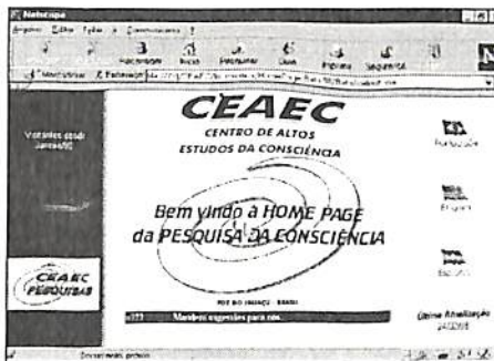
Página frontal da nova home page

As opções para o usuário navegar na home page foram ampliadas, permitindo-se obter visão panorâmica sobre o CEAEC, desde o seu início. Por isso, a partir de agora o usuário poderá cadastrar-se para receber informações sobre o CEAEC e a Agenda de Eventos via e-mail ou mala direta, adquirir publicações e material promocional, cooperar-se, assinar o Jornal, pesquisar referências bibliográficas sobre Conscienciologia e Projeciologia e atualizar-se sobre a Pesquisa no CEAEC - projetos em andamento, laboratórios, glossário básico. Outras facilidades são a possibilidade de contato on-line com o CEAEC através do MIRC, aos domingos das 17h às 18h, solicitando infor-