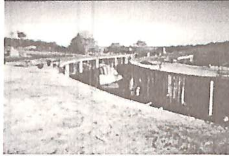
Foram usados 140 metros cúbicos de concreto

Em setembro foi concluída a concretagem da Holoteca. O prédio de 1.400 metros quadrados de laje recebeu 140 metros cúbico de concreto.