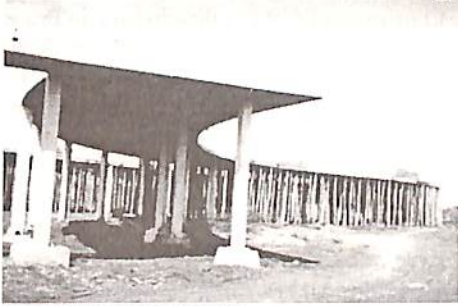
A próxima etapa é drenagem pluvial