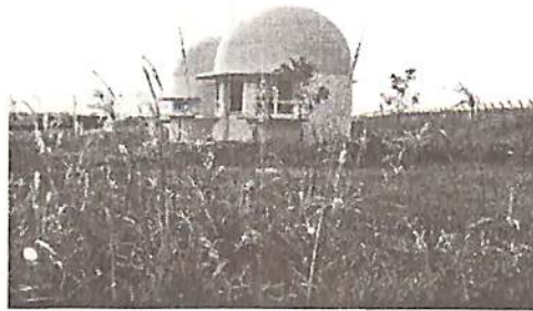
Há lotes à venda

O Condomínio já está cercado e tem uma rua de acesso pavimentada que possibilita locomoção de veículos.