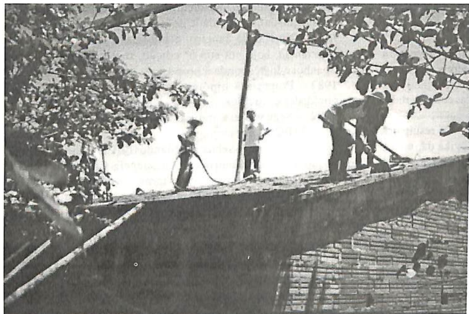
A Basecon será inaugurada em dezembro

A Basecon está sendo construída com recursos provenientes dos cooperados e com a venda de livros.