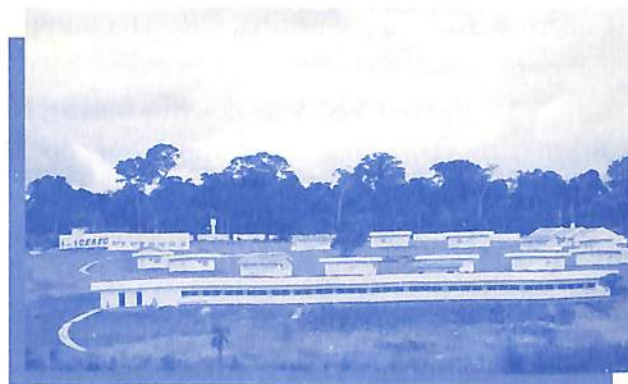
Prestes a completar cinco anos, o CEAEC ocupa uma área total de 243 mil metros quadrados em Foz do Iguaçu, além de sala de apoio em São Paulo e cursos no Espírito Santo

Curso norteou mudanças - A criação do curso de Conscienciologia Aplicada contribuiu para uma efetiva mudança no paradigma administrativo e perfil do CEAEC. O comprometimento em aplicar e vivenciar as idéias da Conscienciologia, levou a equipe a uma verdadeira reciclagem e inovação, proporcionando abertismo para o surgimento de idéias jamais previstas no projeto original. O trabalho pode ser mensurado pelos resultados. A maioria dos colaboradores engajados hoje no projeto CEAEC são alunos do curso que atualmente reúne 7 turmas em Foz do Iguaçu, São Paulo e Espírito Santo em um total de 262 pessoas.