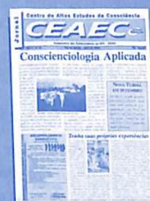
N° 45: nossa equipe destaca mais um projeto marcante: o curso de Conscienciologia Aplicada