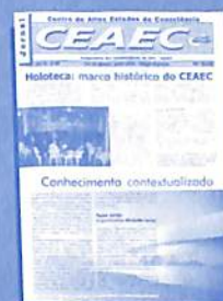
Edição n° 59: reunião define futuro da Holoteca

Assine o jornal do CEAEC e fique por dentro dos principais eventos e acontecimentos: 61 edições, 43 Boletins de Conscienciologia, 50 mil exemplares e 5 anos de história.