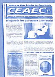
Edição n° 26: início dos experimentos nos laboratórios.

Veja alguns dos principais números do nosso jornal