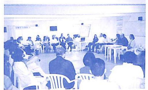
Reunião de Transição

A reunião de transição contou com participação de representantes do CEAEC, da Associação