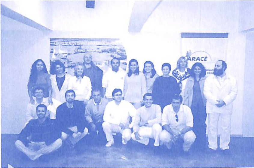
Equipe da Associação CEAEC

Sessenta voluntários de quatro Instituições Conscienciocêntricas (IC's) estiveram reunidos em Foz do Iguaçu dos dias 22 a 26 de julho para a reunião de transição da natureza jurídica do CEAEC. Na ocasião foi fundada a Associação Internacional do Centro de Altos Estudos da Conscienciologia (CEAEC), que passa a administrar a instituição.