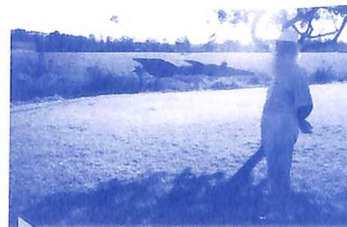
A terraplanagem da Holoteca II foi iniciada em julho.

O outro terreno do CEAEC começou a ser "desbravado" com o início das obras da Holoteca II, no dia 24 de julho. A terraplanagem já foi feita e os próximos passos são a fundação e o levantamento das vigas. As obras, iniciadas pela Cooperativa, serão concluídas pela Associação CEAEC. A cooperativa dispõe de aproximadamente 1/4 dos recursos para a continuidade da obra, cuja arquitetura será semelhante ao prédio atual, sede do Hociclo. Há quatro lotes à venda no Condomínio Campo dos Sonhos para construção da Holoteca. Participe deste empreendimento.