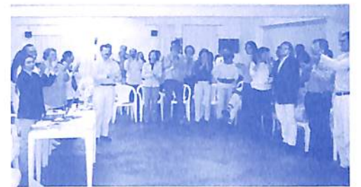
Eleição da equipe da Associação CEAEC