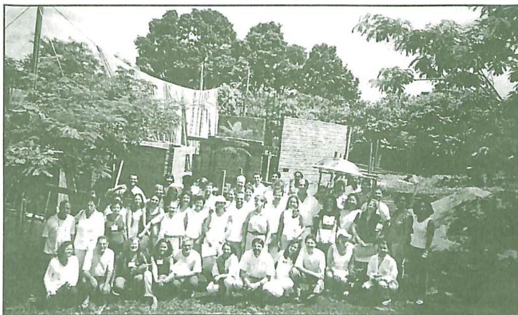
Pesquisadoras do Curso Argumentação Mentalsomática, em frente às obras do Acoplamentarium.

Confira na página 3 as datas, preços e formas de pagamento desse curso inédito.