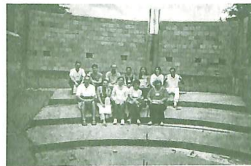
Pesquisadoras do Curso Pilares do Parapsiquismo, nas obras do Acoplamentarium.

Há mais de 40 anos, Vieira já tinha a pretensão de criar um laboratório grupal para desenvolver o acoplamento áurico através da formação de campos energéticos. A partir desses campos de energia, será possível fazer desassédios grupais, desenvolver as parapercepções e identificar fenômenos envolvendo ectoplasmia. A ideia de construir o Acoplamentarium foi definitivamente concretizada depois do curso Pilares do Parapsiquismo , no final de outubro de 2002, quando Vieira realizou, por sugestão da equipe extrafísica, um trabalho grupal que envolveu técnicas de assimilação energética e clarividência facial. Motivados com a oportunidade, alguns pesquisadores presentes no curso se reuniram para elaborar um projeto a fim de viabilizar as obras do Acoplamentarium .