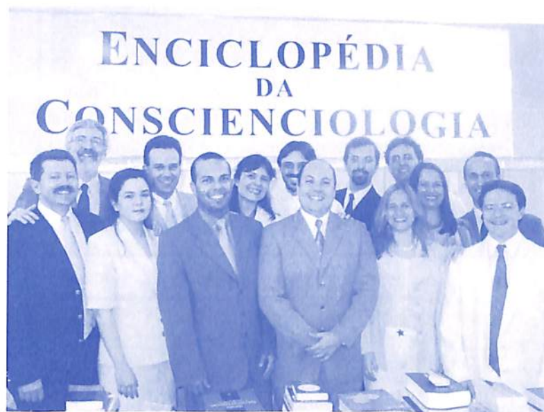
Professores da segunda turma do curso Formação de Autores.

A parte prática do curso será ampliada permitindo ao aluno usufruir mais da estrutura disponível na Holoteca e no Holociclo. Em todos os módulos haverá oficinas de redação e de heterocrítica. A primeira é o momento exclusivo do aluno-autor escrever seu livro, em imersão no balneário bioenergético; a segunda é um espaço de exposições que visa formar um campo interativo de insights a partir das críticas construtivas.