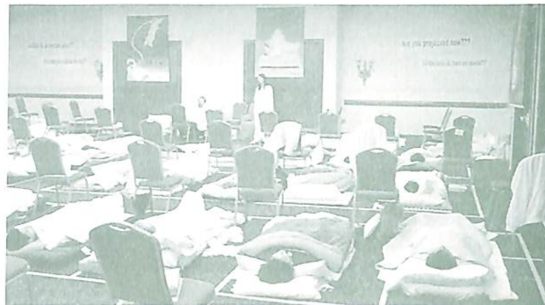
Campo Projetivo, Miami

O Campo Projetivo oferece aos participantes um ambiente otimizado para as vivências de projeções lúcidas, dentro de um contexto de experimentação crítica. Até mesmo os detalhes quanto à fisiologia foram pensados para facilitar a ocorrência do experimento, como a seleção dos períodos em que ocorrerão as tentativas de saída do corpo, as horas de sono, a duração dos intervalos, a comida, a temperatura da sala, dentre outros. A instalação do campo bioenergético, originado a partir do epicentro consciencial energizador lúcido